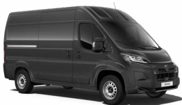
Grey Graphito (málmlitur) MOE9