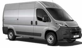
Grey Artense (málmlitur) M0F4