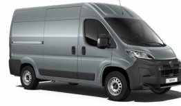
Grey Thunder (einþátt lakk) P02B