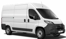
Blanc Icy (einþátt lakk) P0PR