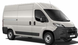
Grey Expedition (einþátt lakk) P04K

Þjónusturegla: Til að viðhalda gæðum og ábyrgð mæla Peugeot og Brimborg með eftirfarandi þjónustutíðni fyrir Peugeot Boxer Van hvort sem kemur á undan km eða tími: 1 ár / 20.000 km. Þjónustuskoðanir eru misjafnar að umfangi eftir aldri bílsins og akstri og því getur kostnaður verið breytilegur eftir því.